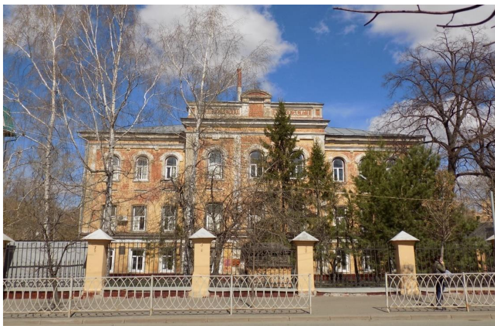
Рис. 2. Современный вид здания бывшего Бактериологического института (ныне – Казанский научно-исследовательский институт эпидемиологии и микробиологии Роспотребнадзора РФ)

10 февраля 1900 г. состоялось открытие Бактериологического института (рис. 2), первым директором которого стал Н.Ф. Высоцкий.