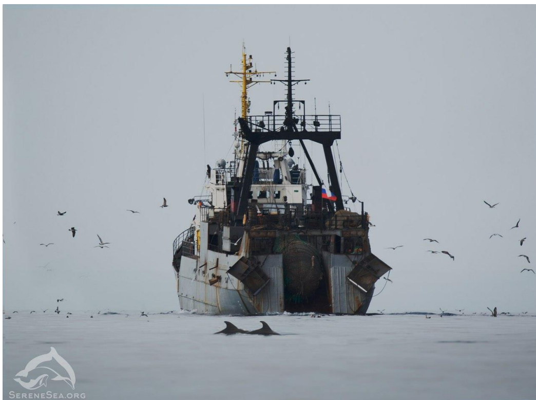
Рис. 5. Сейнер выбирает трал в акватории Судакского района, на переднем плане – две плывущие афалины.

кружки желтого цвета – морская свинья). Афалины : 1 – 22.06.17 г. самка, с отрезанным хвостовым плавником, обнаружена на мелководье, Капсельская бухта; 2 – 04.07.17 г. труп обнаружен в бухте напротив м. Капчик, акватория п. Новый Свет, возле рыболовецкого сейнера; 3 – 21.07.17 г., труп обнаружен на границе акватории п. Новый Свет – акватории г. Судак, с отрезанным хвостовым плавником; 4 – 30.08.17 г. окраина акватории п. Новый Свет, самец, найден возле рыболовецких сейнеров; 5 – 28.06.17 г. самка, обнаружена на мелководье, Капсельская бухта; 6 – 12.06.17 г. самка, найдена на берегу; 7 – 31.07.17 г. окраина акватории п. Новый Свет – акватория г. Судак, самец, с отрезанным хвостовым плавником. Морские свиньи : 1 – 22.06.17 г., акватория п. Новый Свет, Разбойничья бухта; 2 – 02.08.17 г., акватория п. Новый Свет, на мелководье в бухте Царского пляжа, самка; 3 – 11.07.17 г. в акватории на мелководье Капсельской бухты, самка.