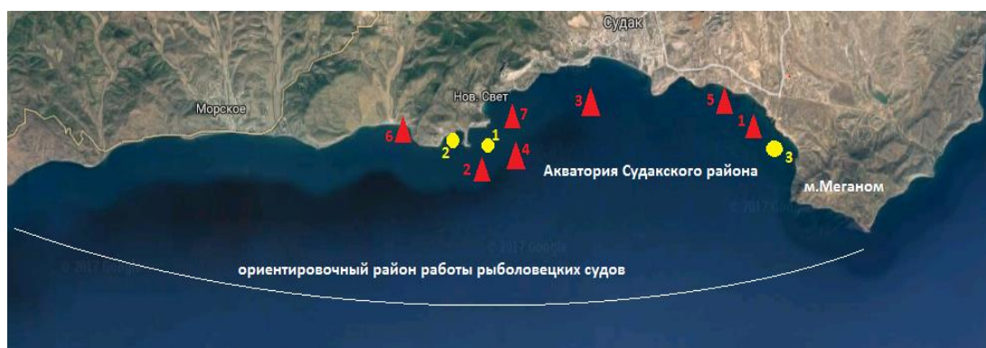
Рис. 4. Места нахождения погибших китообразных, обнаруженных на побережье и в акватории Судакского района (треугольники красного цвета – афалина,