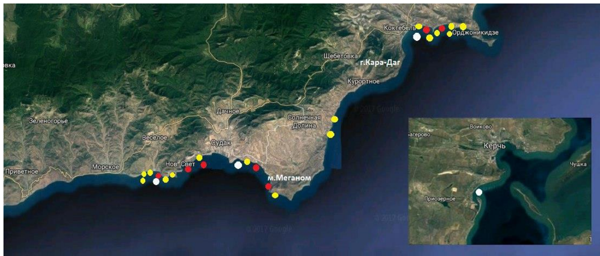
Рис. 2. Местонахождения погибших китообразных, обследованных в ходе выездов на юго-восточное и восточное побережье Крыма (кружки красного цвета – афалина, желтого – морская свинья, белого – белобочка).

Данные о местонахождениях погибших животных, обследованных в ходе выездов, приведены на рис. 2, их характеристики – в таблице 4.