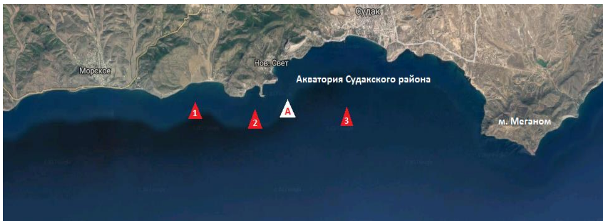
Рис. 6. Место обнаружения самца афалины 30.08.17 г. (А) и места работы рыболовецких судов (1, 2, 3).